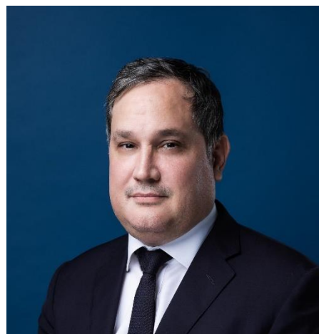
Nagy Márton Nemzetgazdasági Miniszter